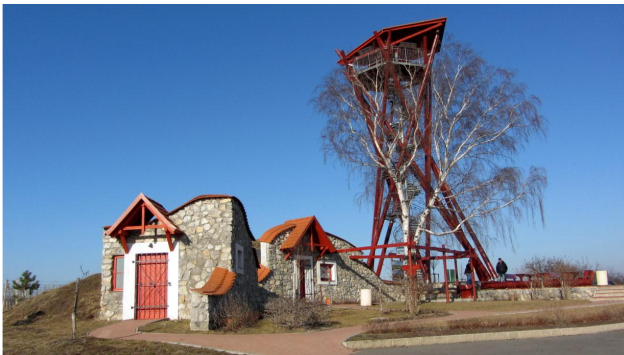
Rozhledna Slunečná